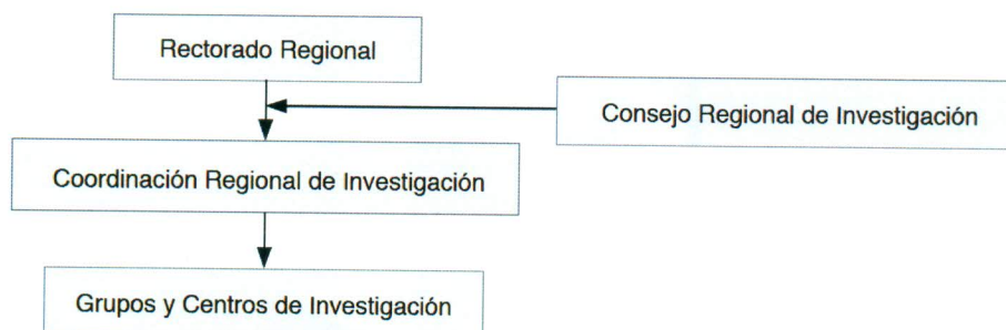
Figura 2. Esquema de organización de la Investigación a nivel regional.

Artículo 10. La conformación del Consejo Nacional de Investigación es la siguiente: